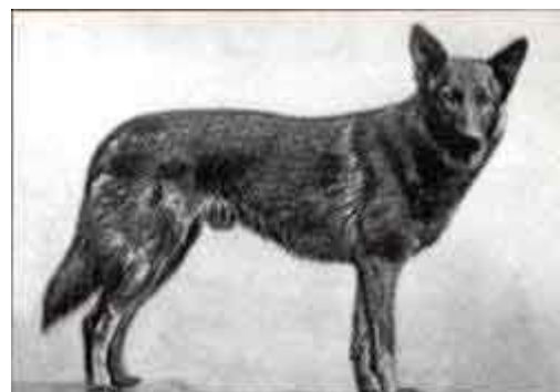
Гектор фон Швабен

Чтобы уравнивать тип породы, Штефаниц подбирал Хоранду для вязок однотипных с ним сук. Сын Хоранда, Гектор ф. Швабен, стал вторым победителем выставки овчарок, а сыновья Гектора — Беовульф, Хайнц ф. Штаркенбург и Пилот-III, — стали основателями трех основных линий, ведущих свое начало от Хоранда. В первые годы необходимо было тщательно контролировать тесное родственное и линейное разведение, обойтись без которого было невозможно, так как оно давало возможность очень быстро выработать единый тип породы.