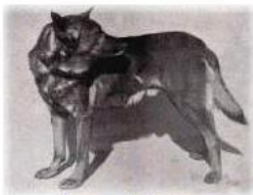
Хоранд ф. Графрат

Подлинным днем рождения немецкой овчарки по праву считается 3 апреля 1899 года. В этот день Макс фон Штефаниц и его друг Артур Мейер развлекались в Карлсруэ и зашли на выставку собак. Осматривая выставку, они обратили внимание на средних размеров кобеля, желто-серого, величиной с волка, который стоял возле своего хозяина. Хозяин объяснил, что кобель является рабочей собакой с большими способностями и, несмотря на сходство с волком, имеет врожденную склонность к служению человеку. Собаку звали Гектор Линкерхайн. Штефаниц купил Гектора для своей псарни, впоследствии он получил имя Хоранд ф. Графрат. Макс фон Штефаниц так писал об этой собаке в своей книге "Немецкая овчарка":